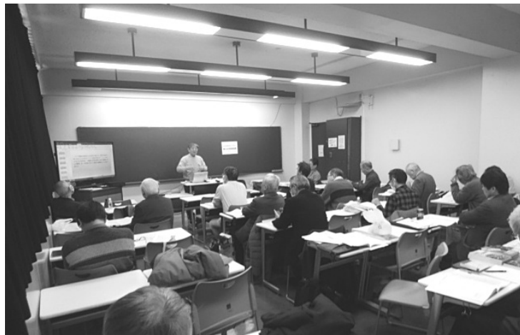
分科会で活発な議論

働き方を選択できる社会」と労働者の権利」のタイムリーで興味深い報告があり、活発な質疑がおこなわれました。また全体で20件の多彩な分科会が開かれ、J S A 武蔵野通研分会からは、IT技術と教育・労働・社会生活、リニア新幹線問題、日本の科学・技術の現状とロマン、戦争と文学など6つの分科会を企画し、熱心に討論されました。