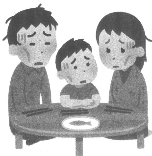
日本ファイナンシャルプランナーズの調査から