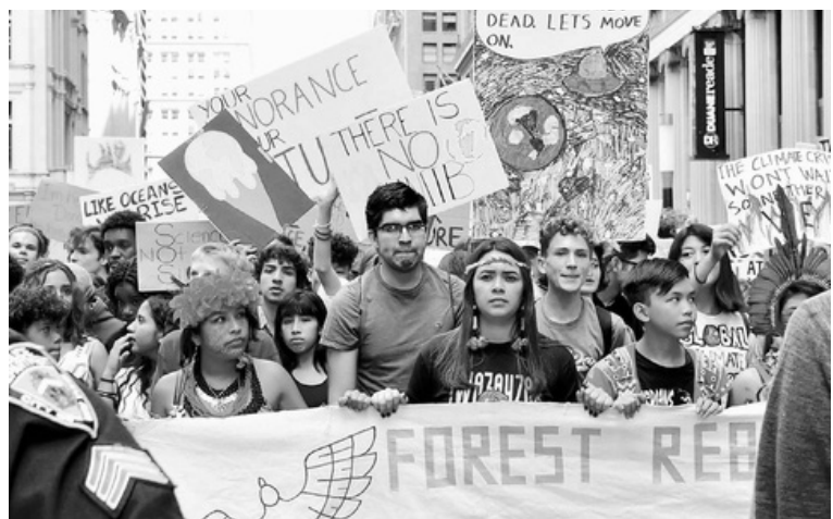
『グローバル気候マーチ』に参加したニューヨークの若者たち(20日)

国連での「気候行動サミット」直前の金曜日の20日に取り組まれた「グローバル気候マーチ」には163カ国で400万人以上が参加、日本では23都道府県で5000人以上が参加しました。ニュ