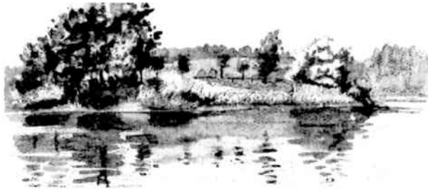
水沢ダム(北海道) 若松倫夫画

編集部 新年おめでとうございます。昨 年を振り返りますと、やはり年末の総選 挙ですね。安倍政権が抜き打ちで解散、 総選挙に打って出ました。選挙では自民 党と正面から対決する日本共産党が躍進 しました。選挙結果や今後の政治の動き に関心が広がるなか、この「新春座談会」 も期待されています。よろしくお願いま す。